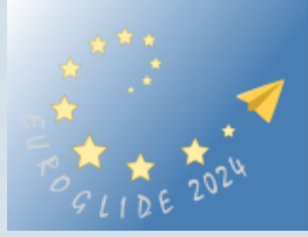
The soaring exhibition from pilots to pilots

Una nuova iniziativa internazionale di volo a vela prevista per il 2024 in alternativa all'AERO (D).